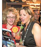
Ein Drink erleichtert die Qual der Wahl zwischen 24 Schaulpätzen.