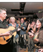
Spanisches Feuer loderte im „Besitos“ mit dem „Gipsy Voices“.