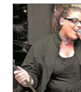
Sie singt, er grinst: Die Combo „Millennium“ verbreitete im Schnuckmuseum beste Laune.