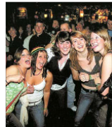
Fünf Engel für Rooney: In „Rooney's Irish Pub“ tobte das Leben.

Now I'm a believer. Erst wer es mit eigenen Augen sieht, glaubt es. Diesen vielen Menschen, diese tolle Stimmung. Ah und Jung vereint – auf einer Tanzfläche. Die Band „Mr. Garcia von Radio-Sender SWR3“. Der hat seine Plattenkisten, prall gefüllt mit Pop von heute und Hits von gestern. Zur „Showtime“ der Schmuckwelten aufgebaut. Einmal richtig eingeeizelt wird die Party zum Selbstläufer. Und das ist nicht alles. „Im „Hofenschlingel“ gibt alle ein wütigen einen (Edele)-Steinwurf mit heißem Soul den Rest. Ein schmuckes Feier-Programm.