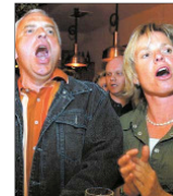
Mitsingen ist erwünscht. Wie hier im „Hofenschlingel“

Zombie. Man muss die Frontfrau der Combo „anyMoone“ nicht sehen, um sie zu bemerken. Ihre Stimme erfüllt jeden Winkel des „troc“, das zu bersten droht: entweder unter der Last der Geste oder unter der Urgewalt ihrer Stimme. Und es erzählt letztere: Eine traurige Geschichte im Original von den „Zombieries“ über Bürgerkrieg in Nordirland, über Zombies, die nur Krieg im Kopf haben. Eine Tragödie, der man eine frohe Kunde abgewinnen kann. Die Dynamik der Musik überbietet alle distanter Untertöne des Liedtextes. Der Zuhörer denkt an Mitsingens statt aus Kämpfen.