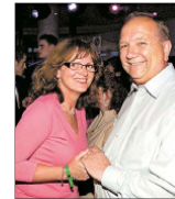
Ein Tänzerchen in Ehren kann keiner vermissen. Nicht in dieser Nacht.

Acoustic Groove. Sehr experimentell klingt das, wenn man es abhört vom „Nightgroove“-Übersichtspunkt. Von Anfangs noch Zweifel hat gegenüber der Stilrichtung, die die Band „B Side“ für sich beansprucht, ist umgestimmt. Soberal der „Irish Pub“ betritt. Nach Freidat und Frohsinn klingt es, was die Musiker anbieten. Wer möchte, nimmt dies zum Anlass, um zu singen, zu tanzen, zu flirten. Gab es vor Musik von „B Side“ eine Packungsbeilage, so würde auf Spuren von Rock, Pop, Soul und Jazz hinweisen. Und es würde gewarnt: Übermäßiger Verzehr kann anrührend wirken.