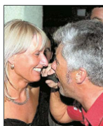
Nur für sie singt er einen Rock-Klassiker im „Bottich“