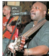
Samba-Pop vom Feinsten wurde im „Mokka“ dargeboten.

Da hat's gefunkt. Frisch, fröhlich, frei von der Seele. Kurzum: „From da Soul“. Das so genannte Sextett macht seinem Namen alle Ehre und präsentiert Titel von Soul-Legenden wie James Brown und Aretha Franklin in Scheinverleerlicht des „Enchilada“. Obendrein gibt es eine Breitereitete filigranen Funk. Dabei hatte es schon vorher gefunkt bei den Zuhörern. Die drängen sich und drücken sich, um den besten Blick auf das Geschehen, das hutes Sängerin und Musikerinnen erhaschen. Es nur zu hören – nein, das reicht nicht. Was so gut klingt, muss nämlich auch gut aussehen.